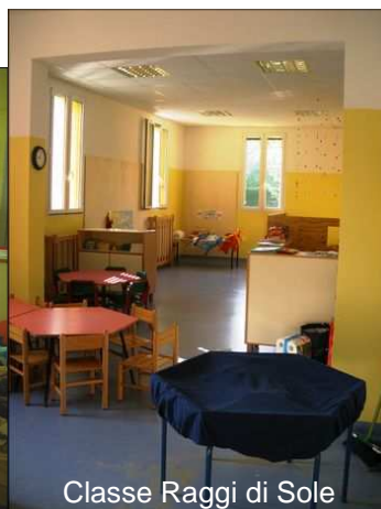
Classe Raggi di Sole